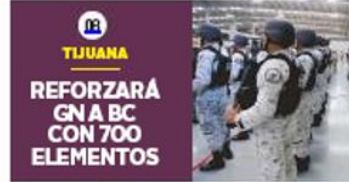
TIJUANA REFORZARÁ GN A BC CON 700 ELEMENTOS

Debido a la pandemia de coronavirus estos planteles registraron una reducción de hasta el 40% de su matrícula, asegura Presidente de la Asociación de Escuelas Particulares en Tijuana. PÁG. 04