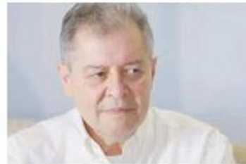
TIJUANA 'MEGA ALIANZA' PODRÍA SACAR A MORENA DE BC: VELOZ 12